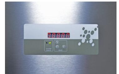
lampCONTROL LT controller

Die leistungsstarke UVC Lampe, macht es möglich den UVELIOS® 500 , mit nur einer Lampe zu betreiben. Andere Hersteller benötigen für die für eine geringere Dosis bis zu 4 Lampen. Das System ist komplett mit einer Lichtfalle ausgestattet. Diese Lichtfalle macht es möglich, dass System auch in niedrigen Räumen zu installieren ohne das eine Gefahr für die Mitarbeiter besteht sich dem UVC Licht auszusetzen.